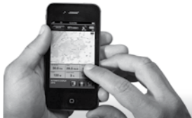
Bluetooth + App Premium