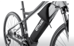
Winter Battery Cover