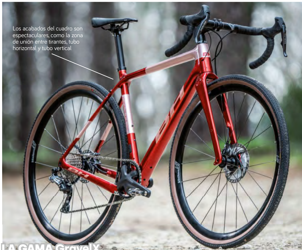
Los acabados del cuadro son espectaculares, como la zona de unión entre tirantes, tubo horizontal y tubo vertical

1/ El guiado interno de cables está muy bien resuelto, tanto por el tubo diagonal como por la horquilla. 2/ El área del pedalier está muy reforzado y su caja más ancha del estándar, de 86,5 mm, permite minimizar las flexiones cuando más fuerza haces sobre los pedales.